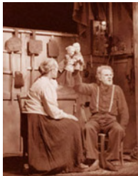
Guy Jutard, Les chaises (m. à gaines)

Le manipulateur est toujours caché (le plus souvent derrière un castelet). Les marionnettes situées au-dessus du manipulateur sont facilement visibles du public.