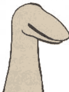
Semi-Complete, anonymous puppet